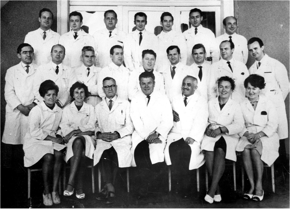
Zespół I Kliniki Chirurgii AM w Poznaniu (ok. 1970 r.).